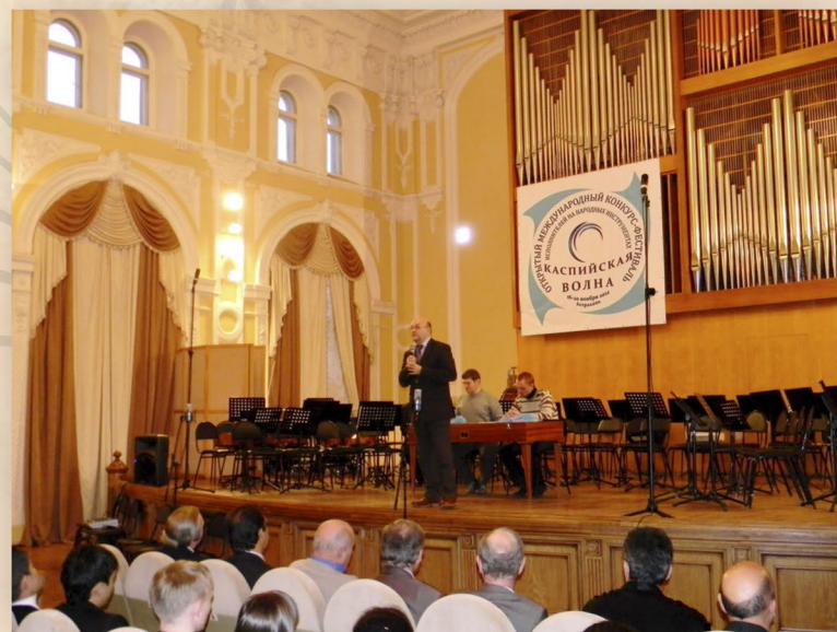
Открытый Международный конкурс-фестиваль исполнителей на народных инструментах «Каспийская волна»