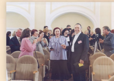
XX Международный конкурс вокалистов имени М.И. Глинки – в Астрахани. Председатель жюри – народная артистка СССР, профессор И.К. Архипова