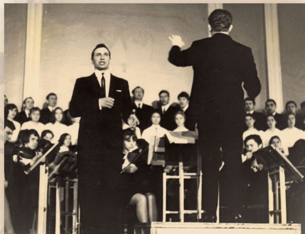
17 апреля Торжественное открытие большого зала консерватории