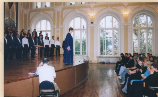
Концерт на открытии большого зала после реконструкции