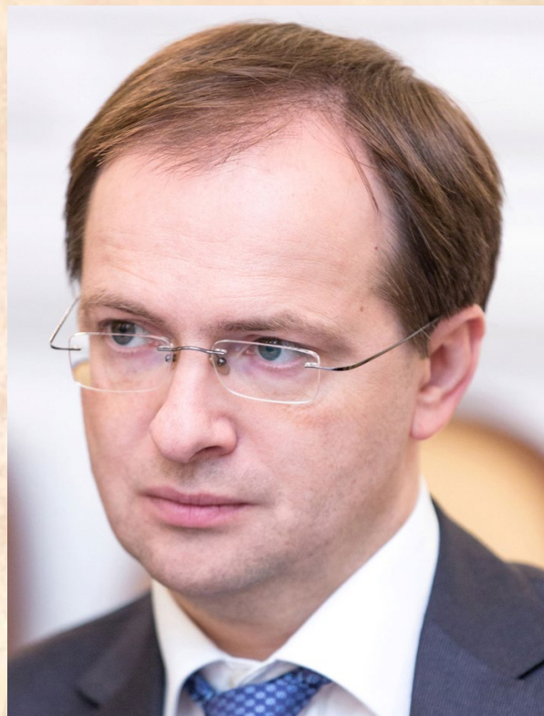
Владимир Ростиславович Мединский Министр культуры Российской Федерации

Убеждён, что коллектив консерватории будет и впредь служить искусству нашей страны, а его выпускники — обогащать её культурную сокровищницу своими яркими работами. Желаю вам успехов, вдохновения и всего наилучшего!