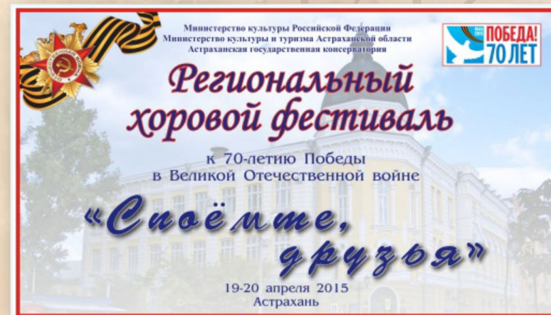
Региональный хоровой фестиваль к 70-летию Победы «Споёмте, друзья»