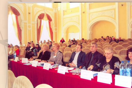
Первый Открытый Всероссийский конкурс вокалистов им. М.П. Максаковой на базе АГК