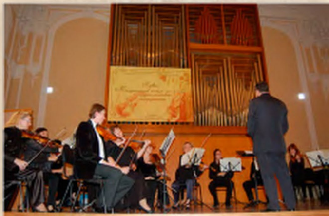
Первый Международный конкурс исполнителей на струнно-смычковых инструментах