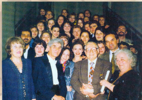
Авторский вечер народного артиста СССР, композитора М.М. Кажлаева в Астраханской консерватории