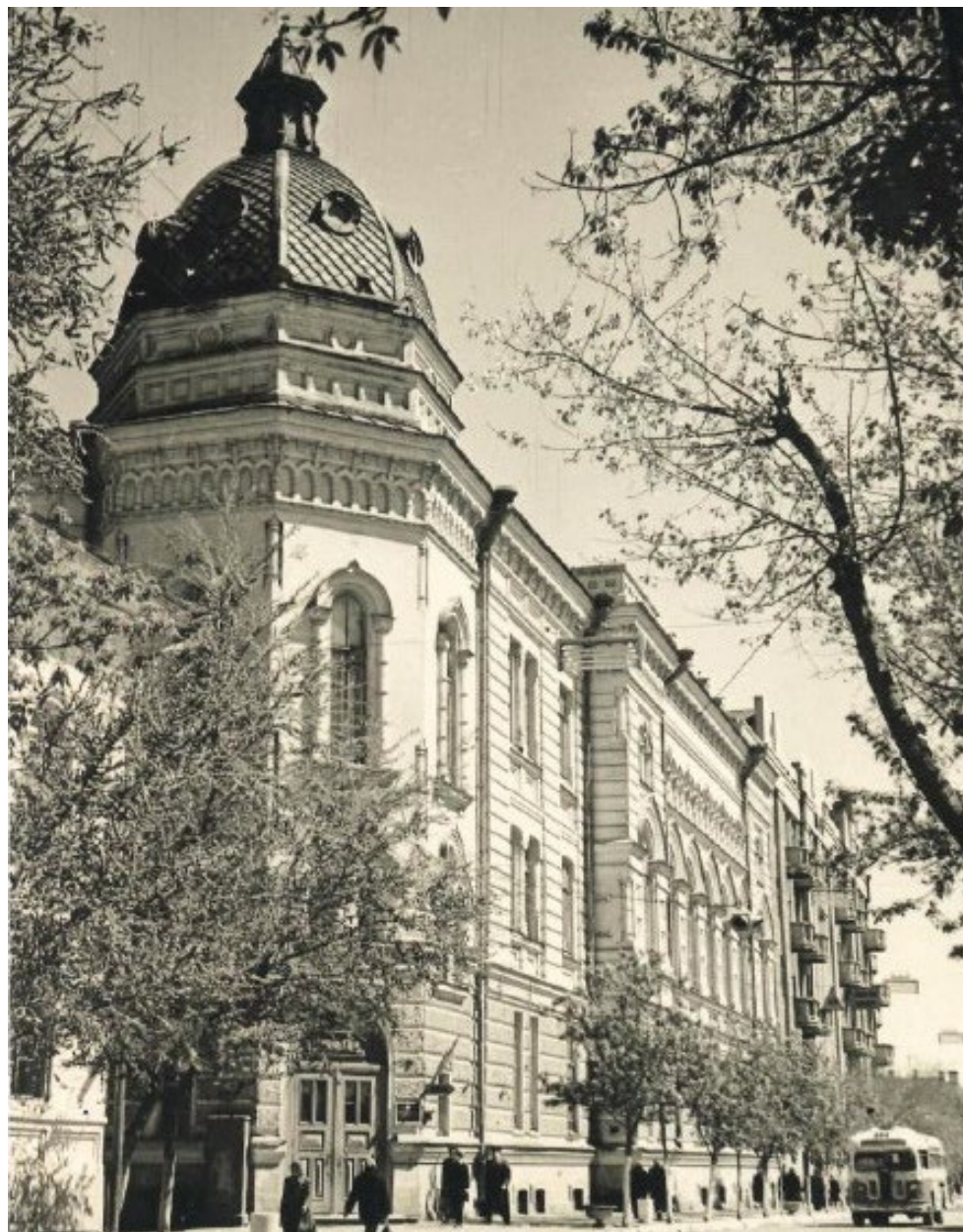
Астраханская государственная консерватория