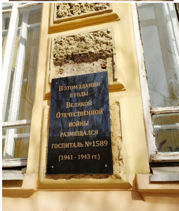
В 1941-1943 гг. здесь размещался госпиталь